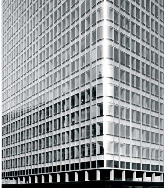
Ecke des Tour Nobeil, Paris - La Défense, 1967.

Als ausgebildeter Kunstschmied galt seine Leidenschaft dem Werkstoff Metall. Die profunde Kenntnis des Materials und der Bearbeitungstechniken bildeten die Grundlage für seine Entwürfe. Zeitlebens lehnte er es ab, nur um der Form willen zu gestalten: Es gibt nichts zu verbergen, die Konstruktion selbst wirkt als bestimmendes Gestaltungselement. Seine Entwürfe entstanden aus rein konstruktiven Überlegungen. Dabei gelangen ihm formal-ästhetisch überzeugende Lösungen, die in ihrer unübersehbaren Materialität nahezu archaisch anmuten.