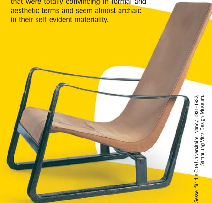
Sessel für die Cité Universitaire, Nancy, 1931-1932, Sammlung Vitra Design Museum.

Prouvé served an apprenticeship as an artisan blacksmith and remained devoted to metal as a material. His profound knowledge of its qualities and the techniques involved in working it formed the basis for his designs. Throughout his life he remained firmly opposed to the idea of creating objects merely for form's sake: he felt there was nothing to hide; the construction itself should be the determining element in the design. His designs arose purely from considerations of construction, arriving at solutions that were totally convincing in formal and aesthetic terms and seem almost archaic in their self-evident materiality.